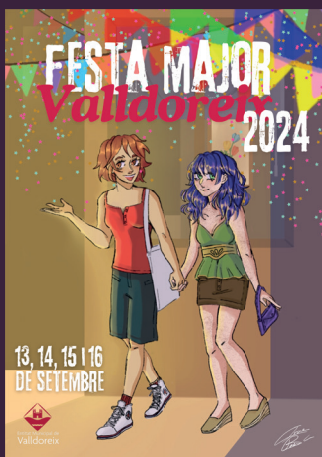
Cartell Guanyador categoria juvenil i cartell anunciador Passeig per les festes de Valldoreix Irene Bach